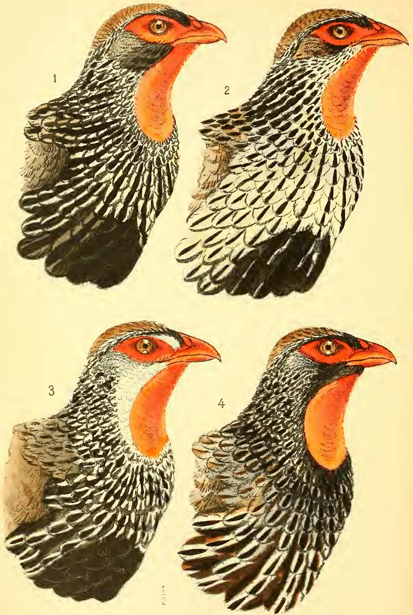
1. Pternistes melanogaster Neum. 2. Pternistes humboldti (Ptrs.) 3. Pternistes leucoparaeus Fsch. Rchw. 4. Pternistes nudicollis (Bodd.)